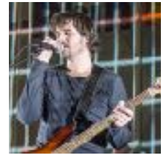
Moodsensor au CG 68