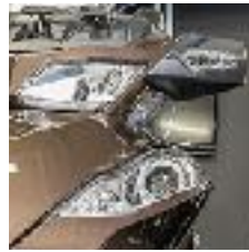
Société Meca Fun